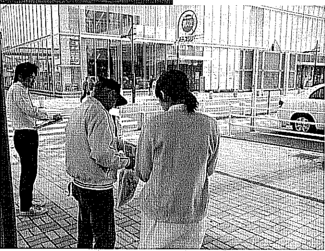
福井駅東口AOSSA前での署名行動