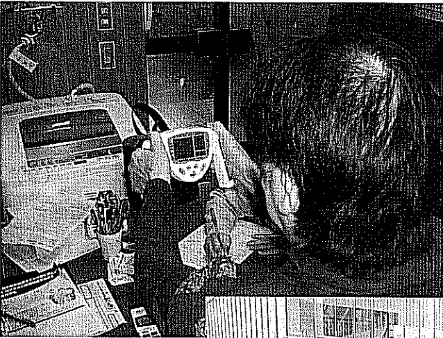
健康チェックの会場で署名がすすめられています